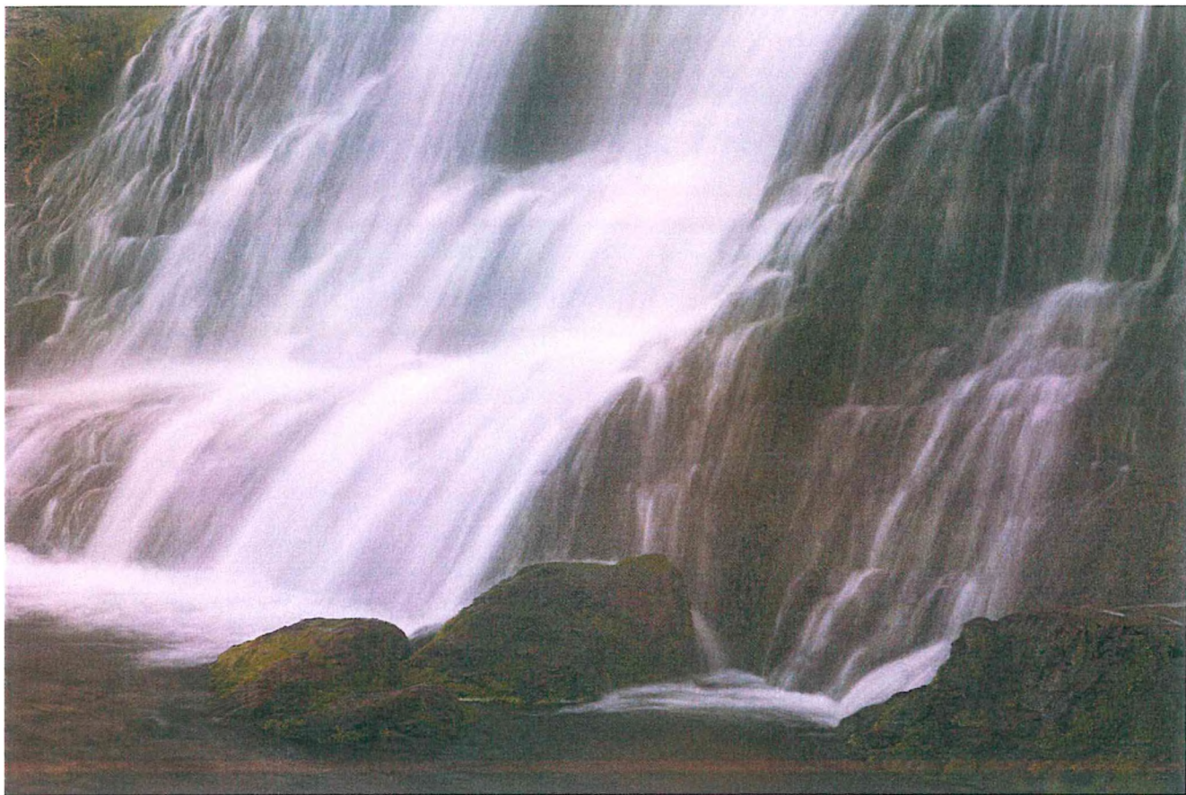
Фото 1. Река Федоскина.