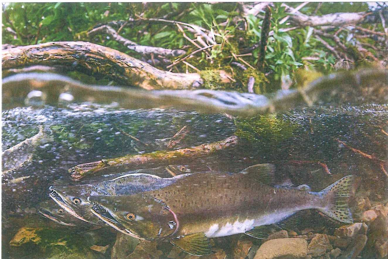
Фото 3. Каскад водопадов побережья.