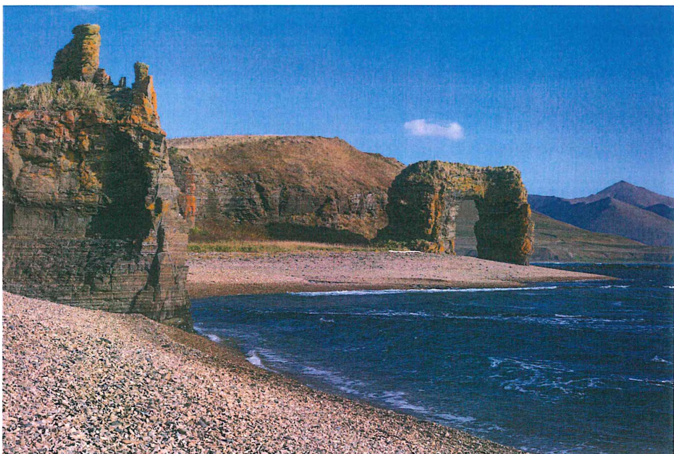
Фото 6. Арка Стеллера.