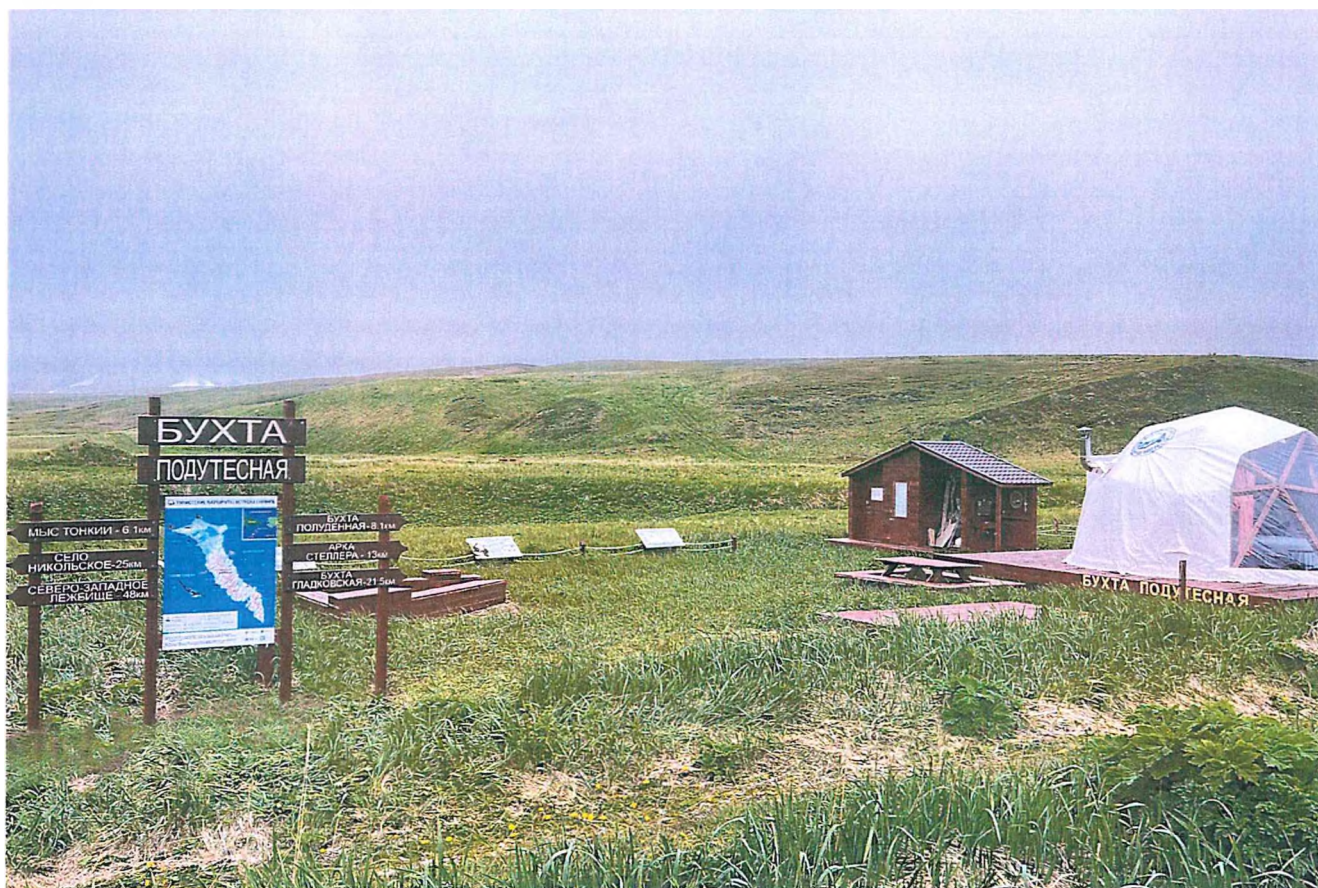
Фото 5. Кордон «Подутёсная».