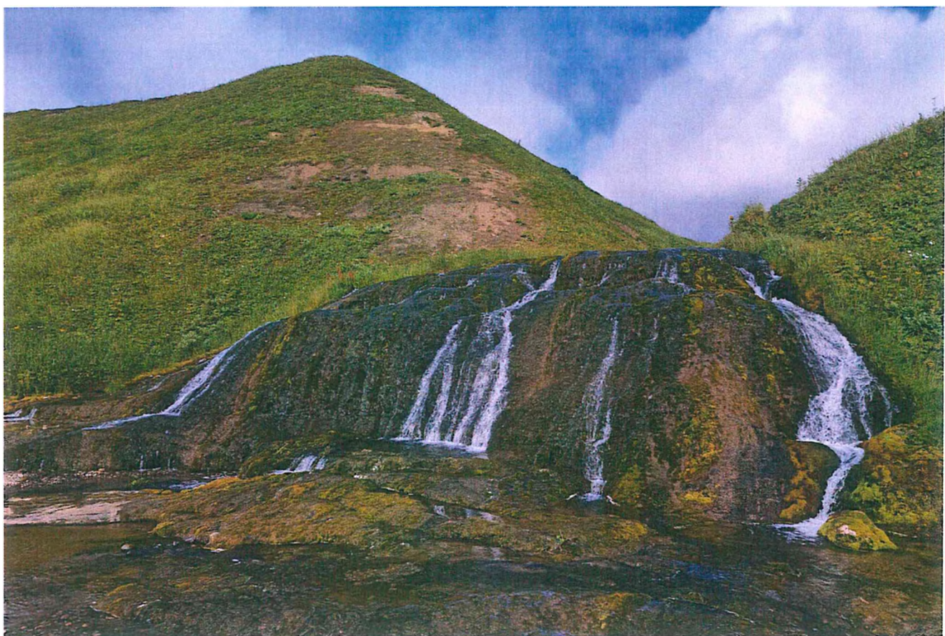
Фото 2. Каскады водопадов побережья.